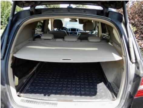
ML 350 (31)