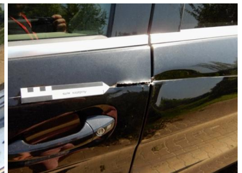
ML 350 (84)