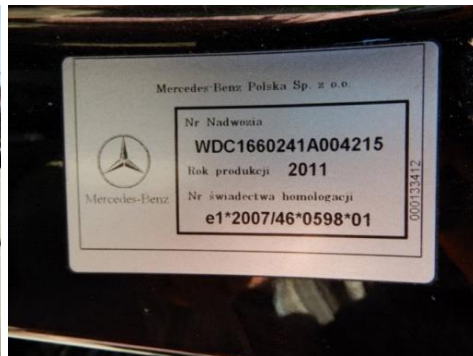
ML 350 (35)