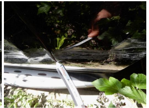
ML 350 (114)