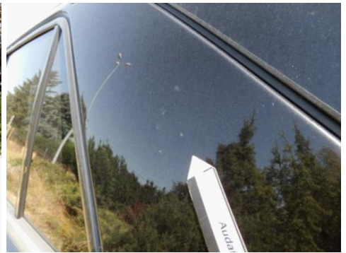
ML 350 (90)