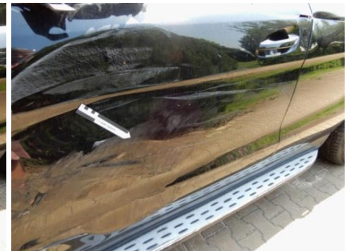
ML 350 (81)