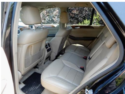
ML 350 (10)