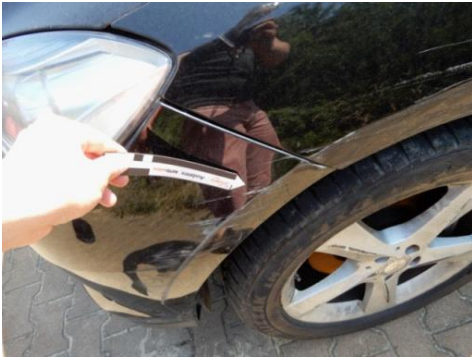
ML 350 (61)