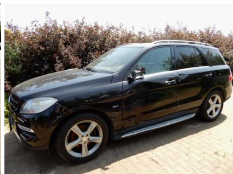
ML 350 (3)