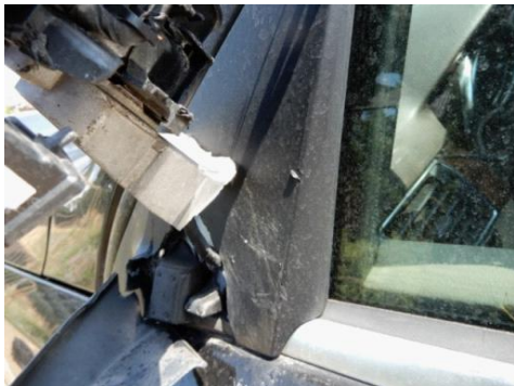
ML 350 (79)