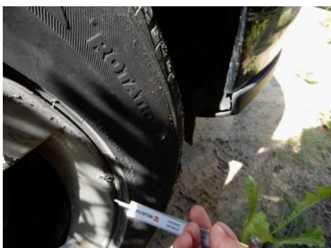
ML 350 (58)