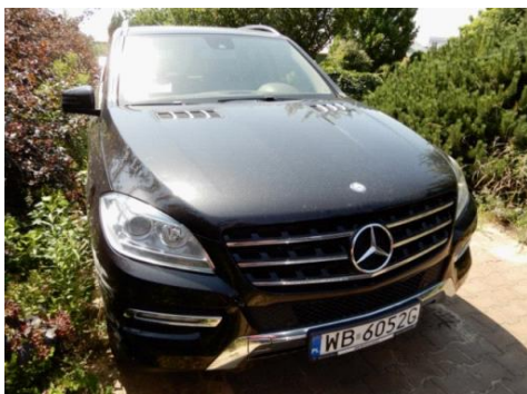
ML 350 (1)