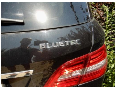
ML 350 (7)