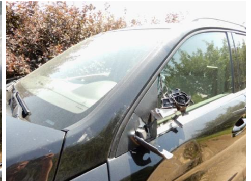
ML 350 (72)