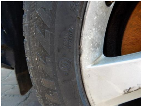
ML 350 (43)