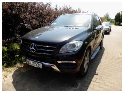
ML 350 (2)