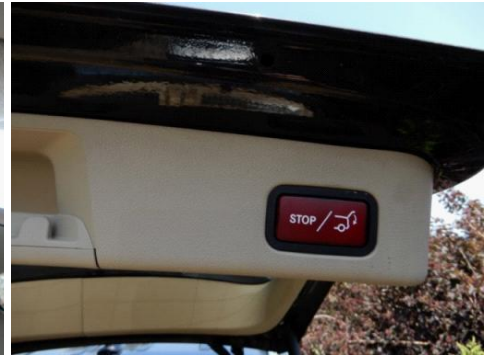
ML 350 (30)