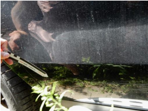
ML 350 (103)