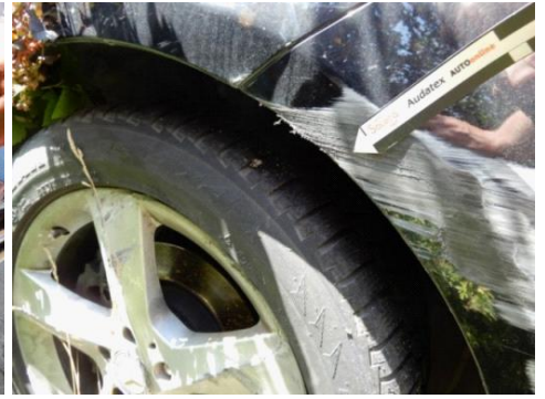
ML 350 (63)