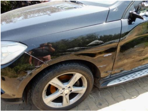
ML 350 (64)