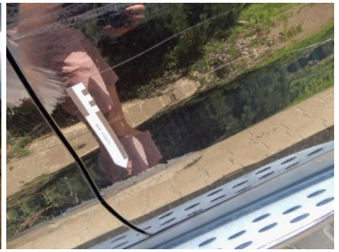
ML 350 (87)