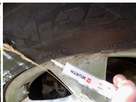
ML 350 (59)