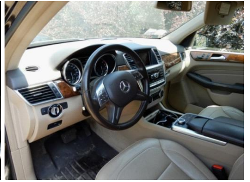
ML 350 (15)