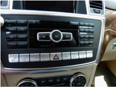
ML 350 (16)