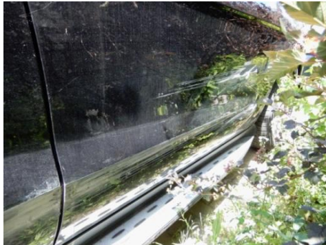
ML 350 (104)