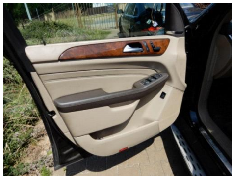
ML 350 (11)