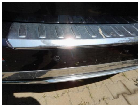
ML 350 (8)