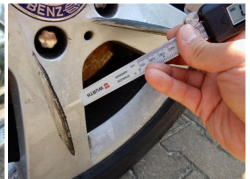
ML 350 (48)