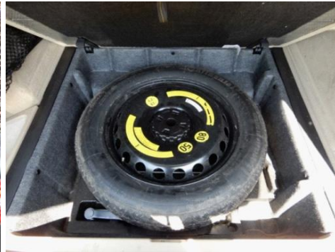
ML 350 (32)