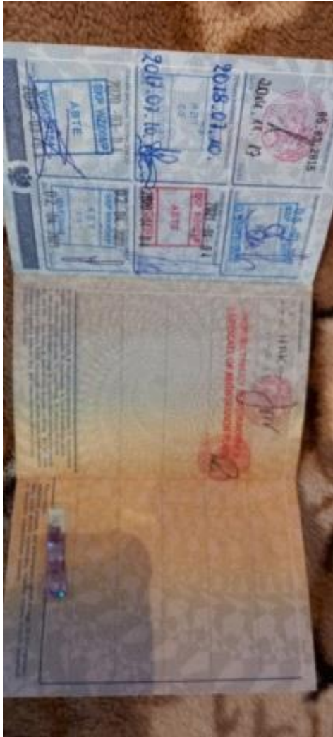
ML 350 (121)