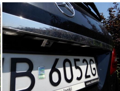
ML 350 (6)