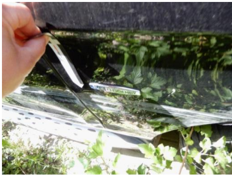
ML 350 (112)