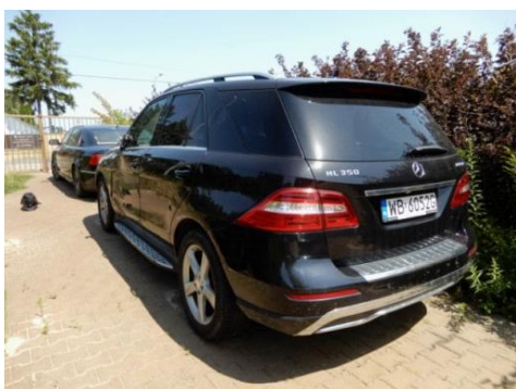
ML 350 (4)