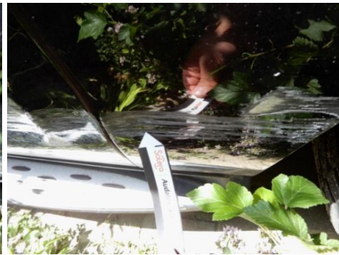
ML 350 (113)