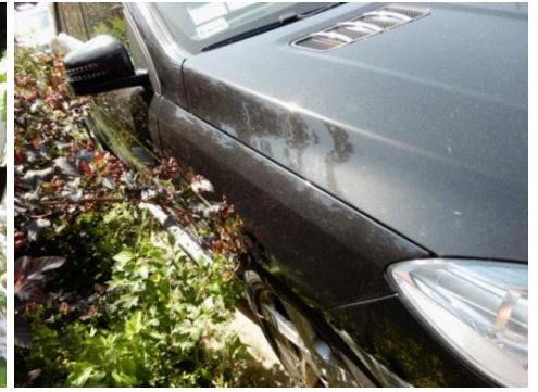
ML 350 (111)