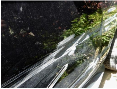
ML 350 (109)