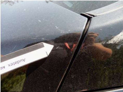
ML 350 (70)