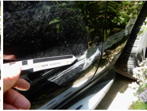
ML 350 (110)