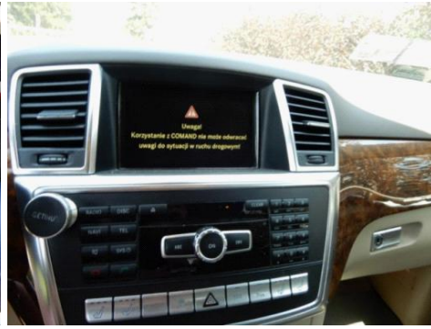
ML 350 (26)