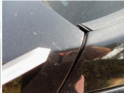
ML 350 (71)