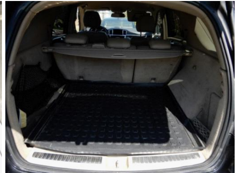
ML 350 (33)