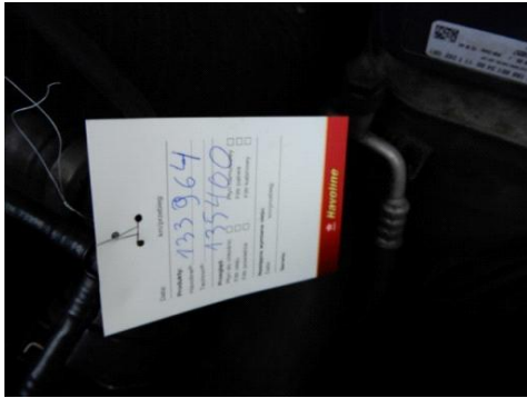
ML 350 (37)