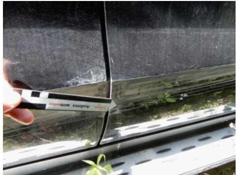
ML 350 (105)