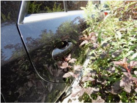
ML 350 (100)