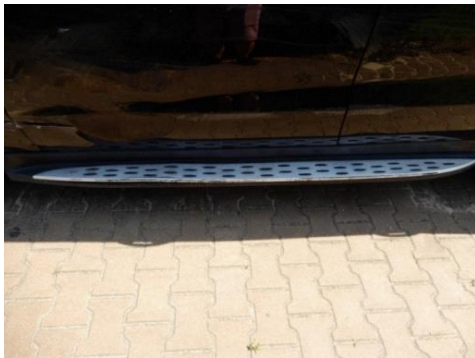
ML 350 (115)