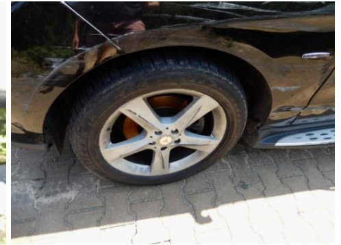
ML 350 (39)