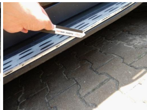
ML 350 (119)