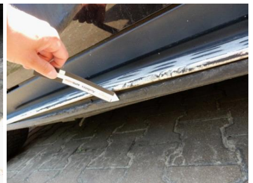
ML 350 (120)