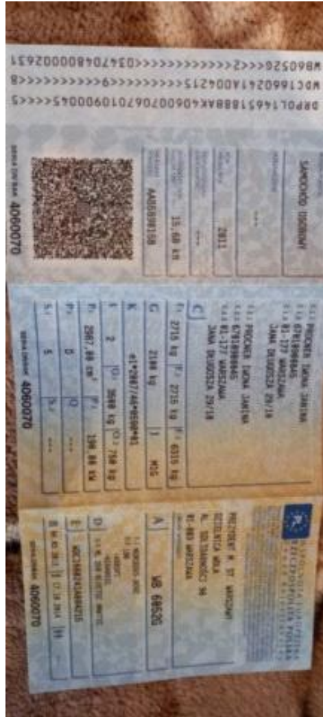
ML 350 (122)