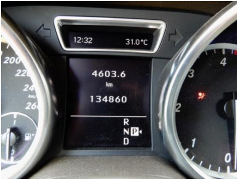
ML 350 (25)