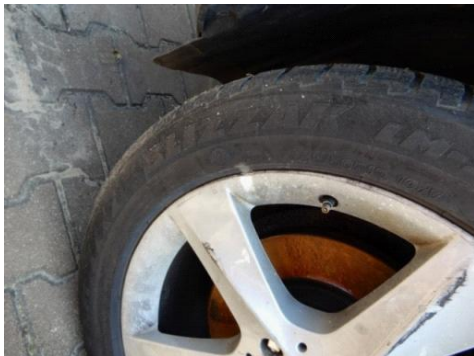
ML 350 (40)