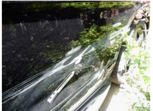
ML 350 (108)