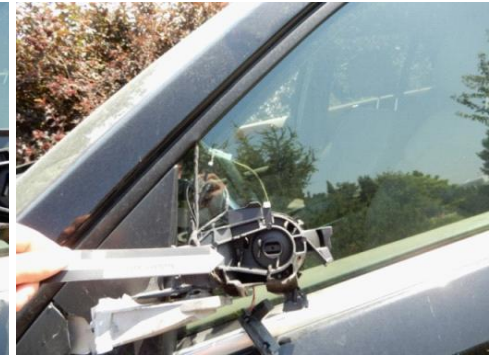
ML 350 (78)