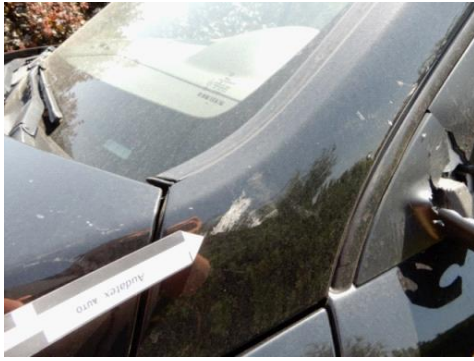
ML 350 (73)