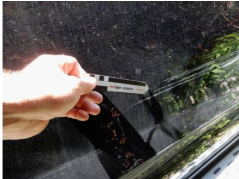
ML 350 (107)