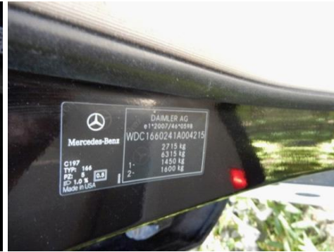
ML 350 (38)