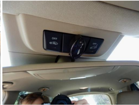
ML 350 (29)