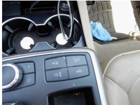
ML 350 (20)