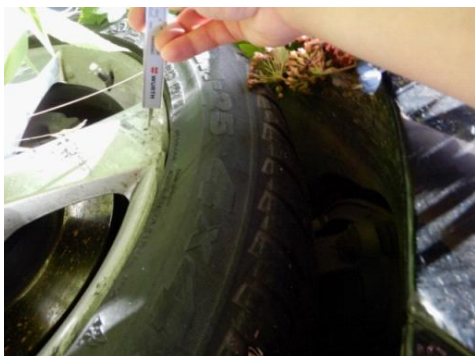
ML 350 (55)