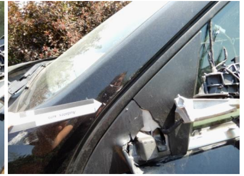
ML 350 (75)