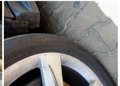
ML 350 (42)