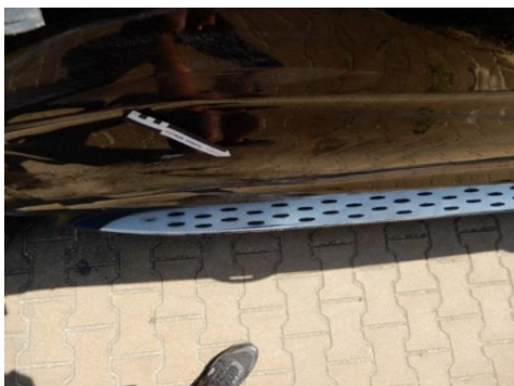
ML 350 (82)