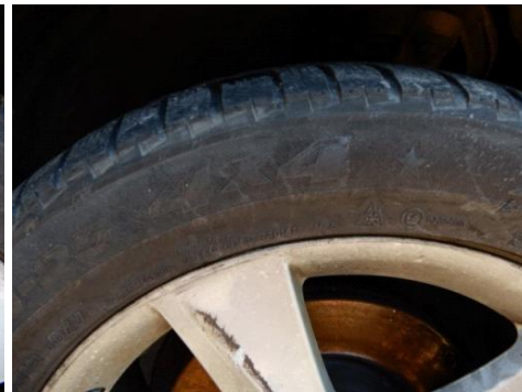
ML 350 (41)