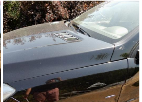
ML 350 (69)