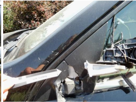
ML 350 (77)