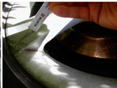
ML 350 (56)