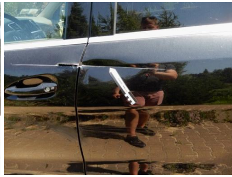
ML 350 (86)