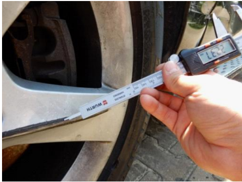
ML 350 (49)