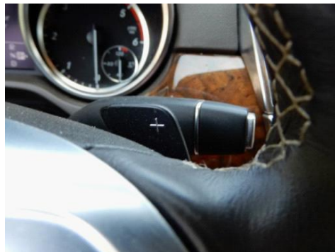
ML 350 (23)