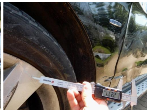
ML 350 (47)