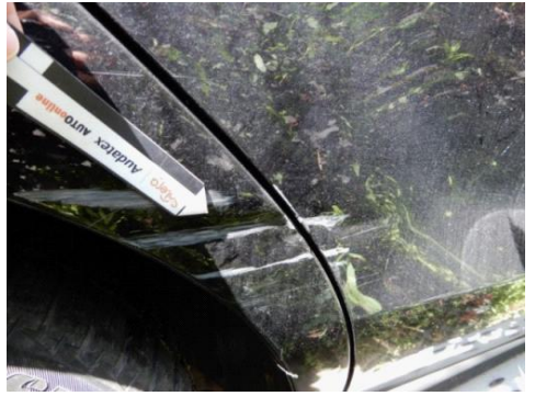
ML 350 (99)