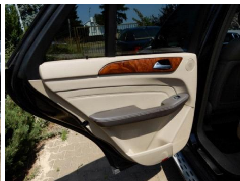
ML 350 (9)