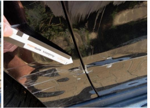
ML 350 (66)