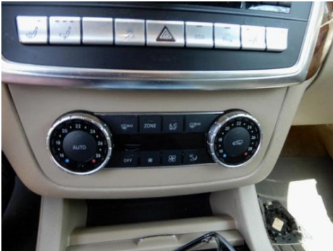
ML 350 (19)