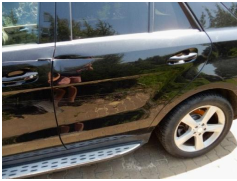
ML 350 (85)