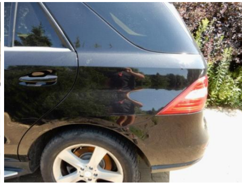
ML 350 (89)