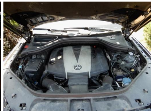
ML 350 (36)