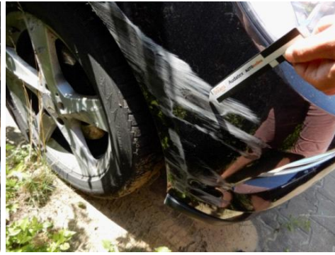
ML 350 (62)