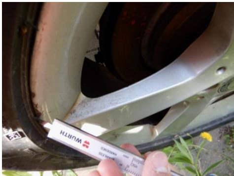
ML 350 (52)