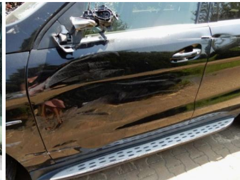
ML 350 (80)