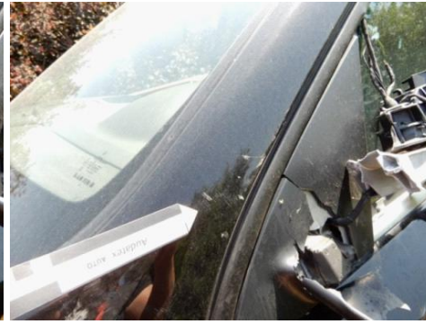
ML 350 (74)