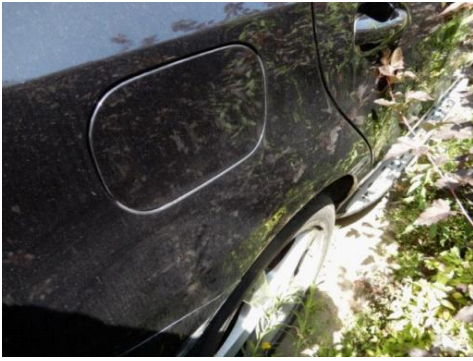
ML 350 (97)