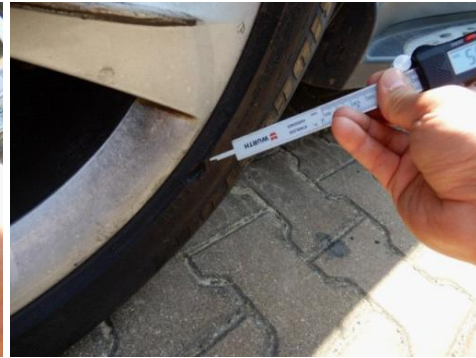
ML 350 (50)