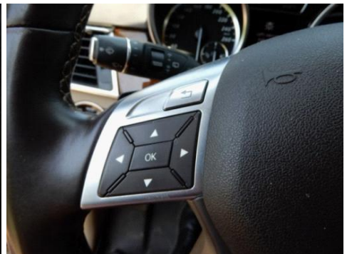
ML 350 (24)