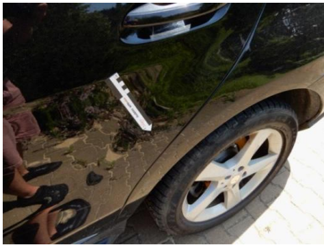
ML 350 (88)