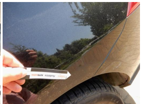
ML 350 (93)