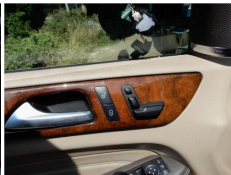
ML 350 (12)