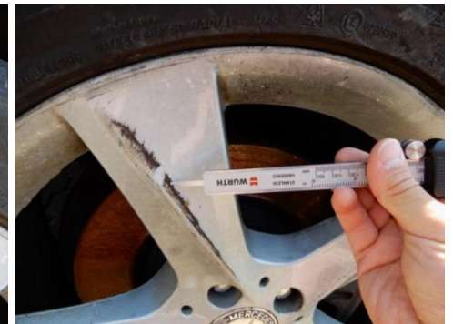
ML 350 (45)