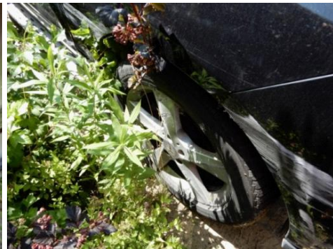
ML 350 (53)