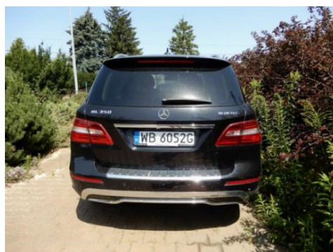
ML 350 (5)