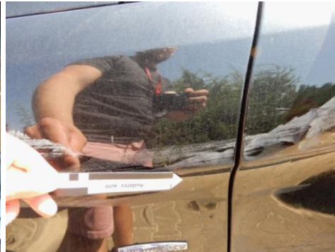
ML 350 (68)