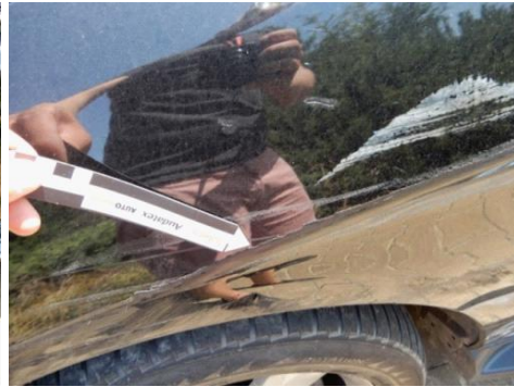
ML 350 (65)