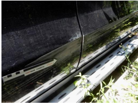
ML 350 (101)