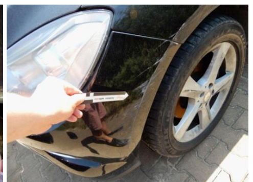
ML 350 (60)