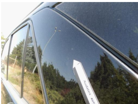
ML 350 (91)