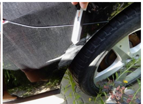
ML 350 (96)