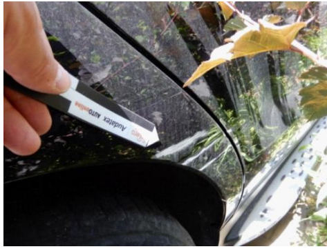
ML 350 (98)