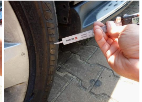
ML 350 (51)