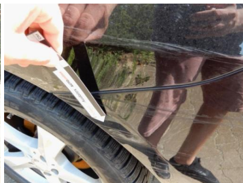
ML 350 (95)