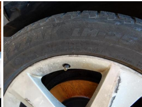
ML 350 (44)