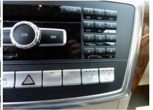
ML 350 (18)