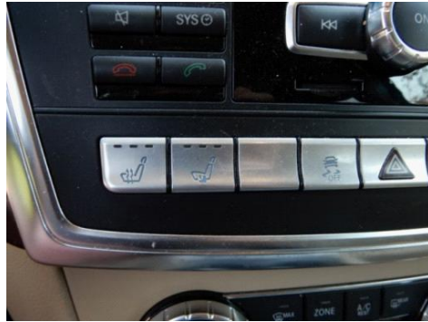
ML 350 (17)