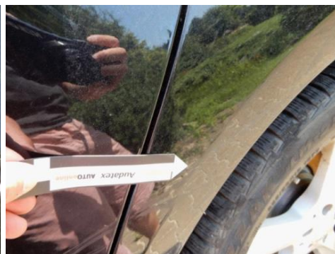
ML 350 (92)