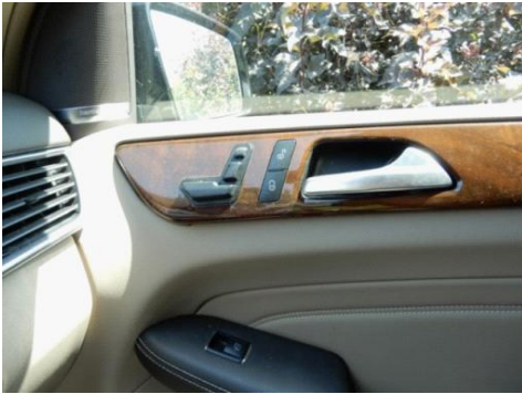
ML 350 (28)