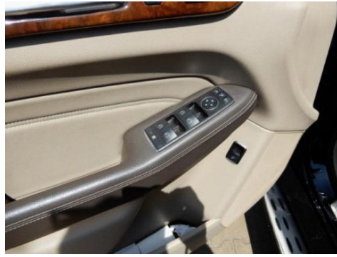
ML 350 (14)