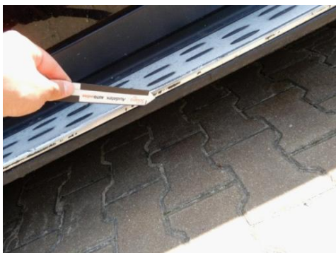
ML 350 (118)