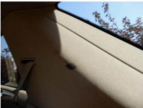
ML 350 (34)