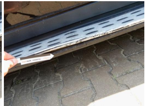
ML 350 (117)