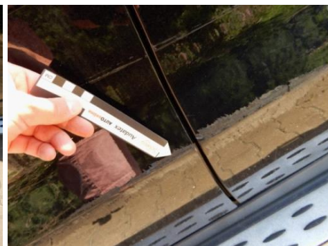
ML 350 (83)