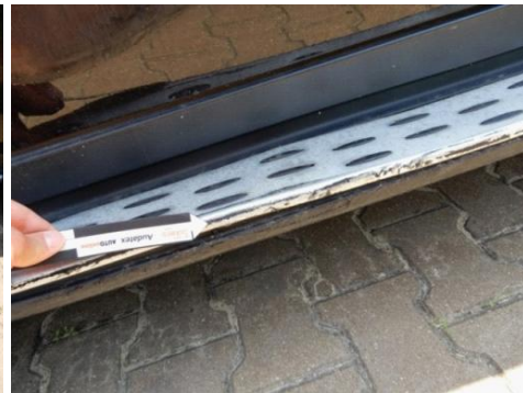
ML 350 (116)