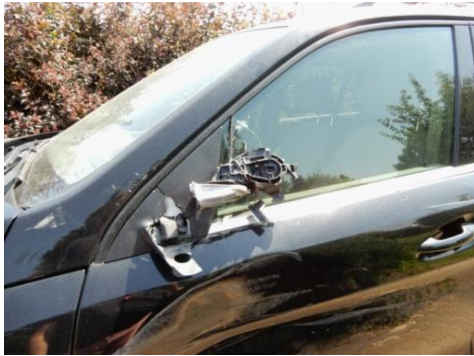
ML 350 (76)