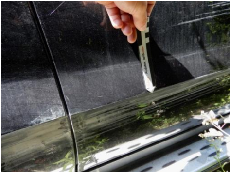
ML 350 (106)