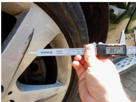
ML 350 (46)