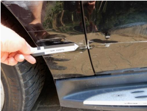
ML 350 (67)