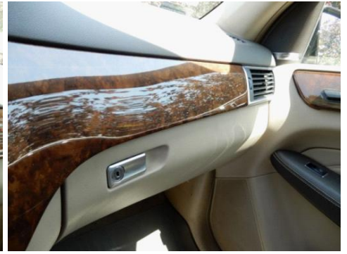
ML 350 (27)