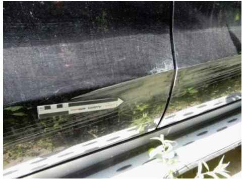
ML 350 (102)