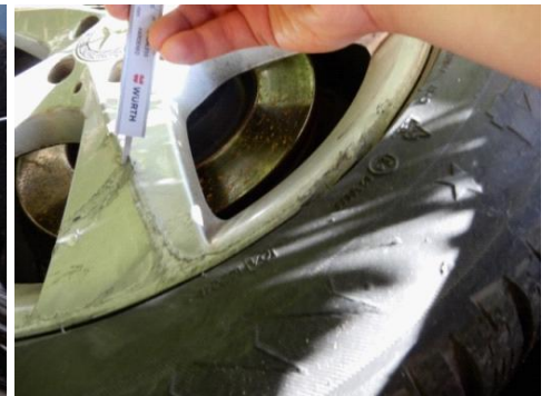
ML 350 (54)