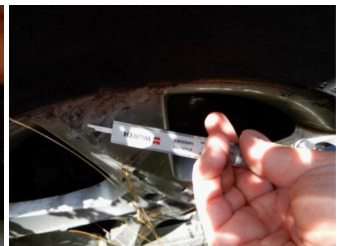
ML 350 (57)