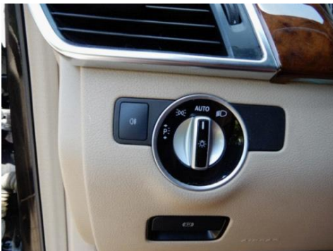
ML 350 (22)