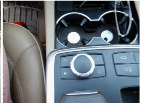
ML 350 (21)